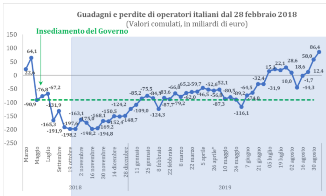
Grafico 3. Guadagni e perdite virtuali sui tre mercati principali dal 28 febbraio 2018 al 06 settembre 2019

* Il dato di venerdì 19 aprile non è disponibile data la chiusura di Piazza Affari per le festività pasquali; la variazione delle perdite è stata quindi calcolata rispetto al 12 aprile 2019.